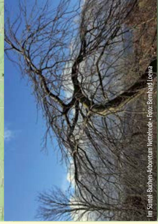
Im Süntel-Buchen-Arboretum Nettelede.