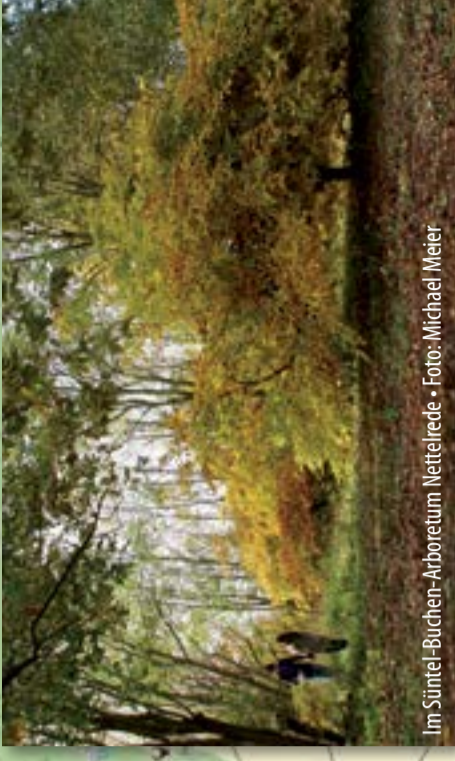
Im Süntel-Buchen-Arboretum Nettelede.

DIGITALE KARTOGRAPHIE Herbertsdorfer Graphisches Institut Eckmann GmbH Rappstraße 10 • 31024 Hannover • Telefon: 051 31 94 81-0 © GeoInfo - www.stadtplangrafik.de